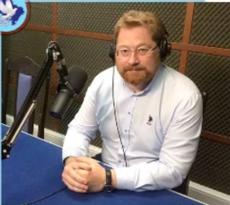
Некоммерческая церковь ЕХБ города Истра